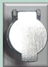
CHROME STEEL INLET-VALVE