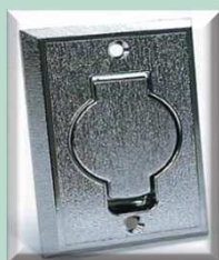
CHROME STEEL INLET-VALVE